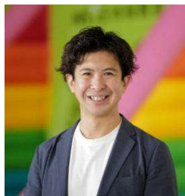
ネイス株式会社 代表取締役